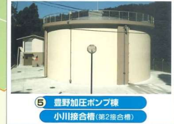
5 豊野加圧ポンプ棟 小川接合槽 (第2接合槽)