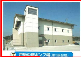
7 戸馳中継ポンプ場 (第3接合槽) 履行場所