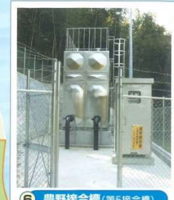
6 豊野接合槽 (第5接合槽)