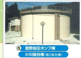
5 豊野加圧ポンプ棟 小川接合槽 (第2接合槽)