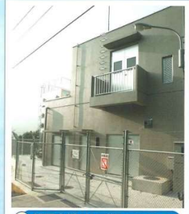
8 姫市中継ポンプ場 (第6接合槽)