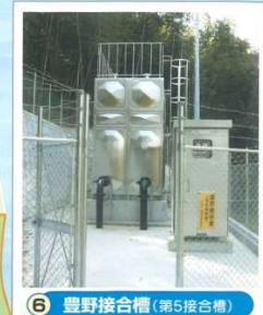
6 豊野接合槽 (第5接合槽)