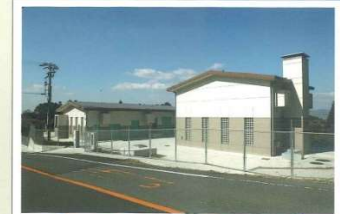
4 小川中継ポンプ場 (第1接合槽)