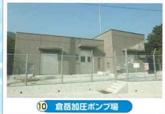
10 倉岳加圧ポンプ場