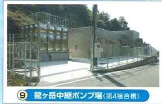
9 龍ヶ岳中継ポンプ場 (第4接合槽)