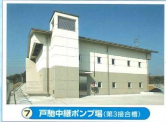
7 戸馳中継ポンプ場 (第3接合槽)